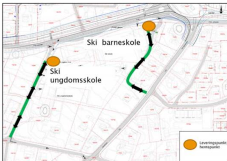
Figur 42 – Foreslått løsning for nyttetransport til Ski skole.

Reguleringsbestemmelsen § 5.2 Torg: Innkjøring Sanderveien tillates ikke , må sees i sammenheng med valg av atkomstløsning til nyttetransport til skolene.