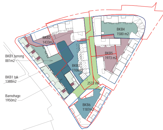
TILGJENGELIG AREAL PÅ TERRENG, LOKK OG TAK, IKKE STØVTSATT