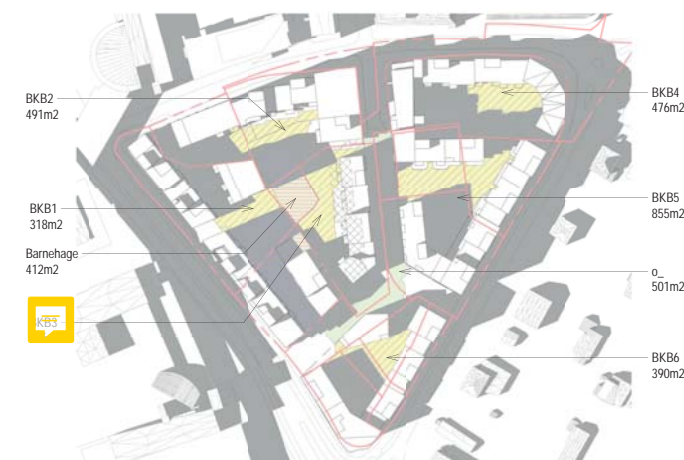
01.05. kl 17 BKB1 med 4 bygg og barnehage i syd