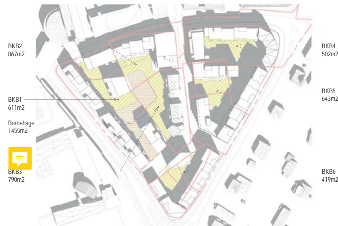
01.05. kl 12 BKB1 med 4 bygg og barnehage i syd