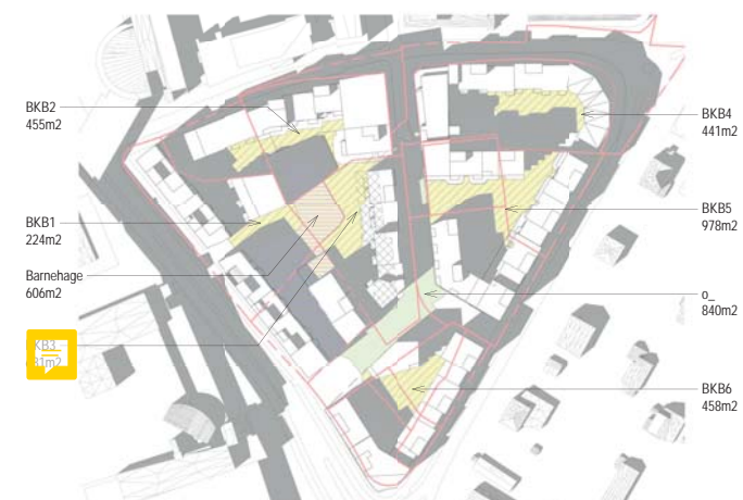
01.05. kl 16 BKB1 med 4 bygg og barnehage i syd