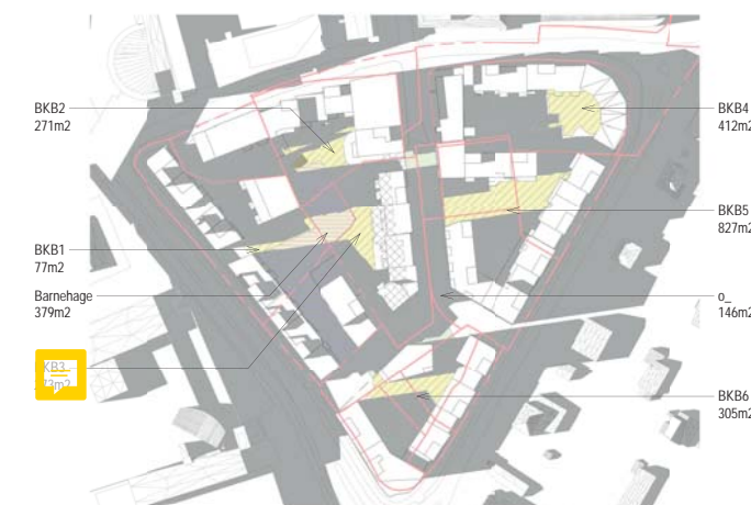
01.05. kl 18 BKB1 med 4 bygg og barnehage i syd