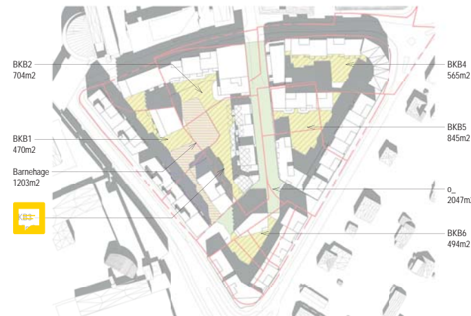
01.05. kl 13 BKB1 med 4 bygg og barnehage i syd