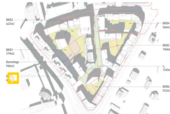
01.05. kl 14 BKB1 med 4 bygg og barnehage i syd