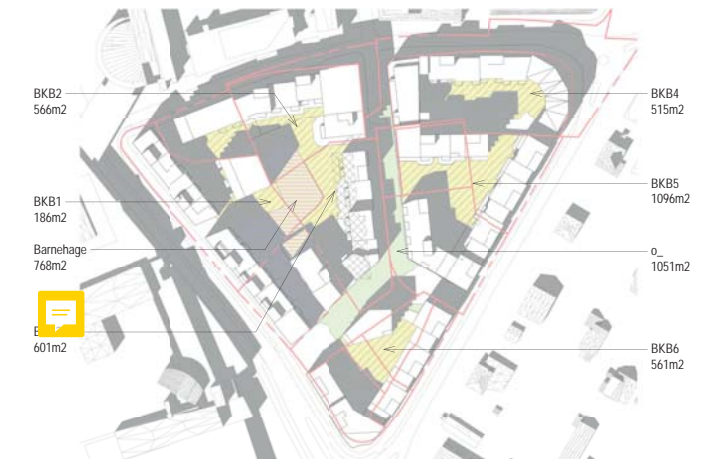
01.05. kl 15 BKB1 med 4 bygg og barnehage i syd