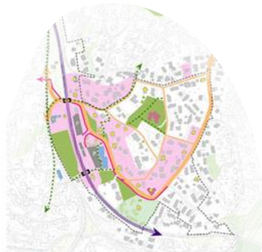
Figur 47: Oppsummering stedsplanen