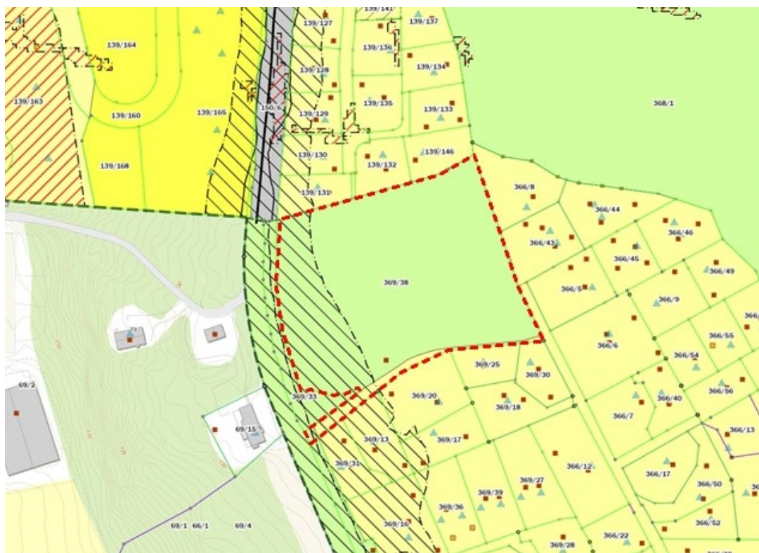
Utsnitt fra kommuneplanen

Området fremstår inneklemmt og avskåret fra annet landbruksareal mellom bebyggelse og vei i alle fire retninger. Foreslått omregulering og utbygging vil naturlig fylle et hull i utbyggingsstrukturen og kunne utnytte eksisterende infrastruktur. Eiendommene rundt er utbygget med boligbebyggelse, nærmere bestemt konsentrert og frittliggende småhusbebyggelse. Nærhet til natur og rekreasjon gjør beliggenheten meget attraktiv. Området ligger i gangavstand til Ski sentrum (under 2 km fra Ski togstasjon).