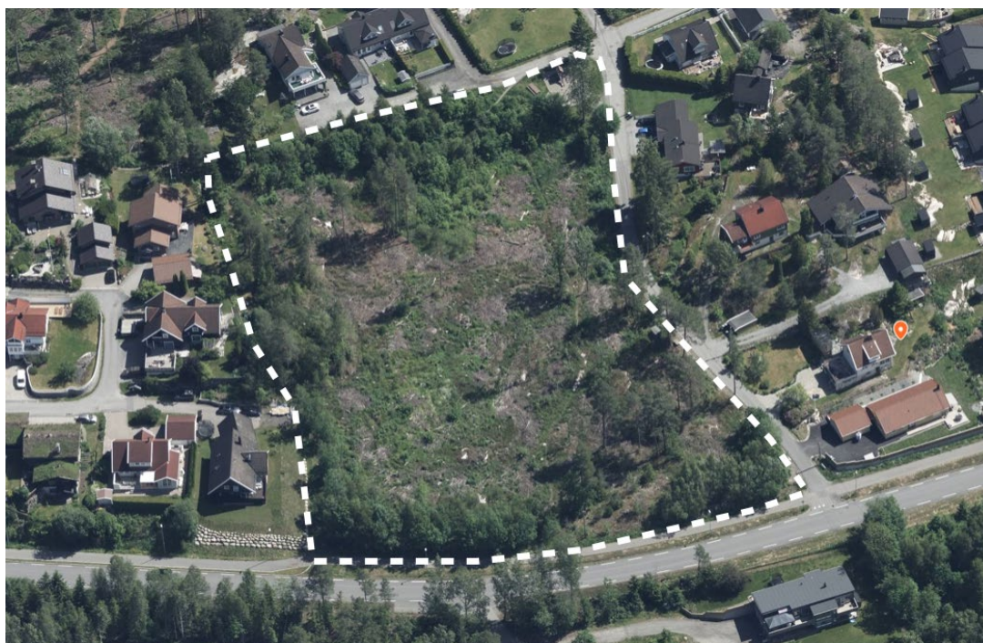
Sett fra luften