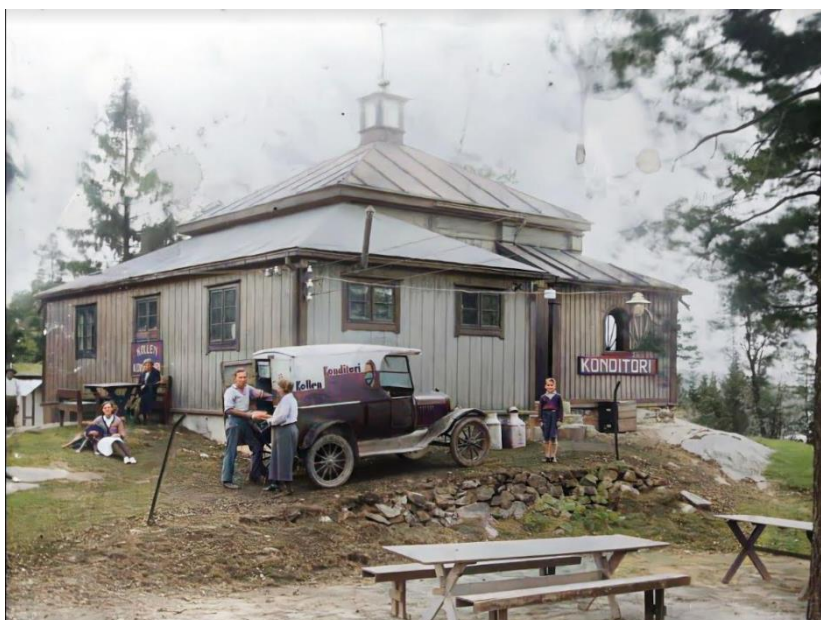
Bilde av Nidar paviljongen på Kollen (Ukjent år)

I dag bærer Kollen preg av forfall. Det gror igjen og det er mye søppel på Kollen. Det er lite som tyder på at dette er et godt møtested.