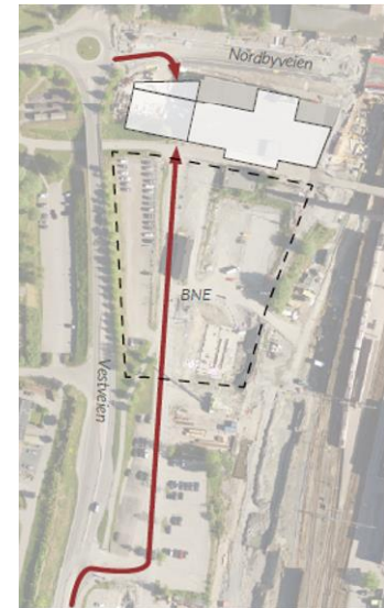
Utsnitt :2 Innkjøring fra Nordbyveien og Vestveien ved fremtidig utvikling