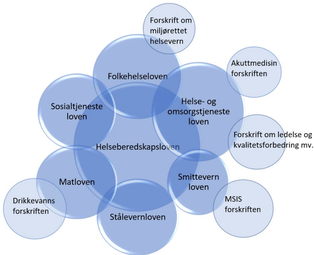
Figur 1: Konglomerat av lover som regulerer helseberedskap