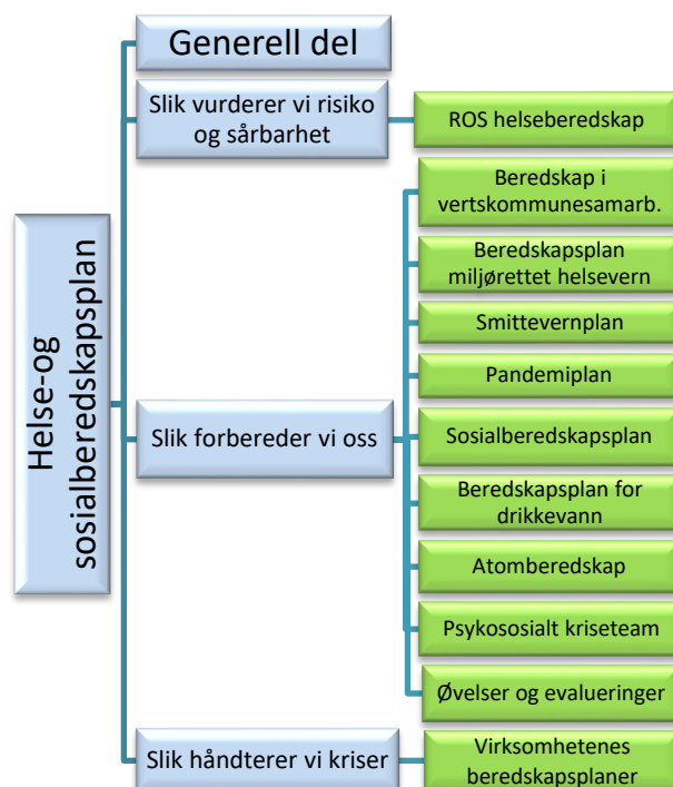
Figur 3: Struktur Helse- og sosialberedskapsplan for Nordre Follo

Beskrivelse av håndtering i form av konkrete tiltakskort vil ligge til taktisk nivå og beredskapsplanene til den enkelte virksomhet.