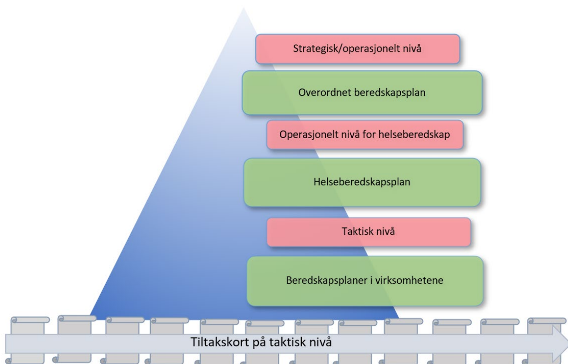
Figur 2: Innsatsnivåene i helseberedskapsplanen i Nordre Follo, Kilde: Kerstin Anine Johnsen Myhrvold

Denne planen sammen med tilhørende delplaner er å regne som en plan på operasjonelt nivå som definerer rammene for samarbeid, koordinering og prinsippene for håndtering av en krise. Den beskriver særlig varsling, ansvarsforhold og ressurser.